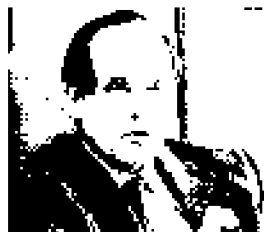
Il procuratore Greco

Verifiche su assunzioni e mobilità Chiosi: il Comune faccia chiarezza